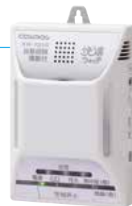
▲5センサータイプ多機能型ガス警報器「快適ウォッチ」

現金購入のほかに、月額制のリース契約(一部製品対象外)もご用意。取替時期のご案内や異常時のサポートもおまかせください。設置・交換のご用命は、お気軽にガス局へお電話ください。