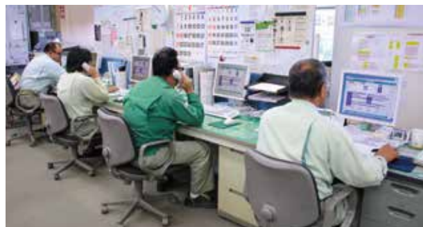
通報の受付を行う保安センター▲

また、震度4以上の地震や特別警報が発令され、被害の発生が予想される場合にも、被害の拡大防止のため、休日・夜間を問わず職員が参集し、迅速に対応できる体制を整えています。