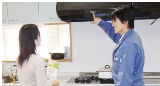
ガス設備点検の様子▲

ガス設備点検では、ガス配管の検査やガス機器の設置状況、給排気設備の調査などを行ない、ガス漏れの有無や、ガス機器が正しく設置されているかを確認し、点検結果をお知らせします。万が一異常があった場合には、改善方法についてご提案します。