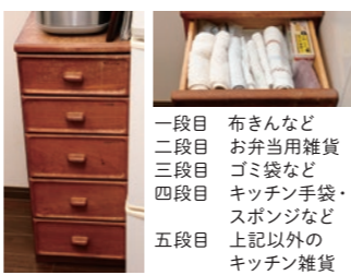
一段目 布きんなど 二段目 お弁当用雑貨 三段目 ゴミ袋など 四段目 キッチン手袋・スポンジなど 五段目 上記以外のキッチン雑貨