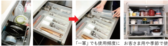
「一軍」の毎日使う食器類はすぐ取り出せる場所に 「一軍」でも使用頻度によって上下二段に分ければ収納量UP お客さま用や季節で使用する食器は普段使いのものとは分けて収納

普段使いの食器は、台所内のすぐ取り出せる場所に。お客さま用などは少し遠くに収納してもOK。