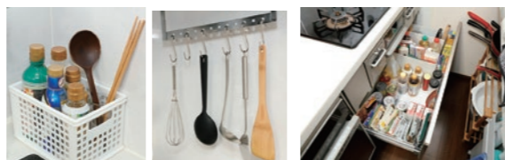
「一軍」の調味料や道具は手の届く場所に 「二軍」の調味料や道具はコンロ下の収納に

使用頻度の高い調味料や道具をすぐ手につくコンロ脇に置くことで、「引き出す」手間を省く。コンロまわり・水まわりで収納する道具を工夫。