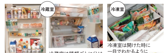
冷蔵室は種類ごとに分けて収納。常に少しスペースを空けておくと「残りモノ」や「おすす分け」が入れる 冷凍室は開けた時に一目でわかるように立てて収納