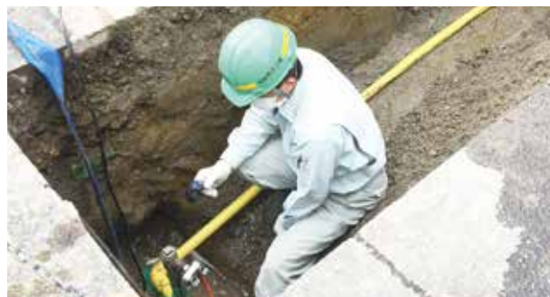
ガス管取替工事の検査▲

お客さまの敷地内に埋設されているガス管のうち、白ガス管（亜鉛メッキ鋼管）は長年、土中に埋設されることで、徐々に腐食が進んで老朽化している場合があります。ガス局では、この白ガス管を耐震性・耐腐食性に優れたポリエチレン管などへ取り替えるようお勧めしています。