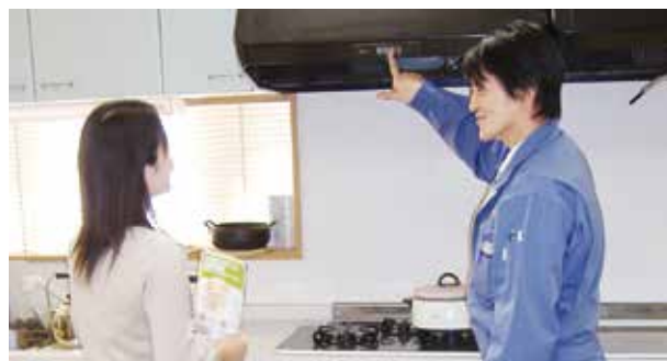
ガス設備点検の様子▲

ガス設備点検では、ガス配管の検査やガス機器の設置状況、給排気設備の調査などを行ない、ガス漏れの有無や、ガス機器が正しく設置されているかを確認し、点検結果をお知らせします。万が一異常があった場合には、改善方法についてご提案します。