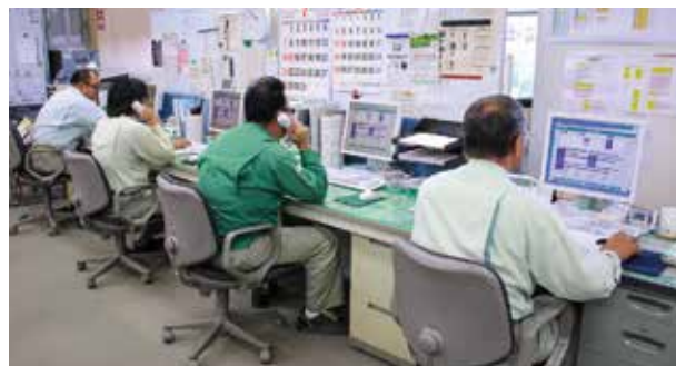
通報の受付を行う保安センター▲

また、震度4以上の地震や特別警報が発令され、被害の発生が予想される場合にも、被害の拡大防止のため、休日・夜間を問わず職員が参集し、迅速に対応できる体制を整えています。