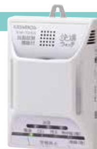
▲5センサータイプ 多機能型ガス警報器 「快適ウォッチ」

現金購入のほかに、月額制のリース契約 (一部製品対象外) もご用意。取替時期のご案内や異常時のサポートもおまかせください。設置・交換のご用命は、お気軽にガス局へお電話ください。